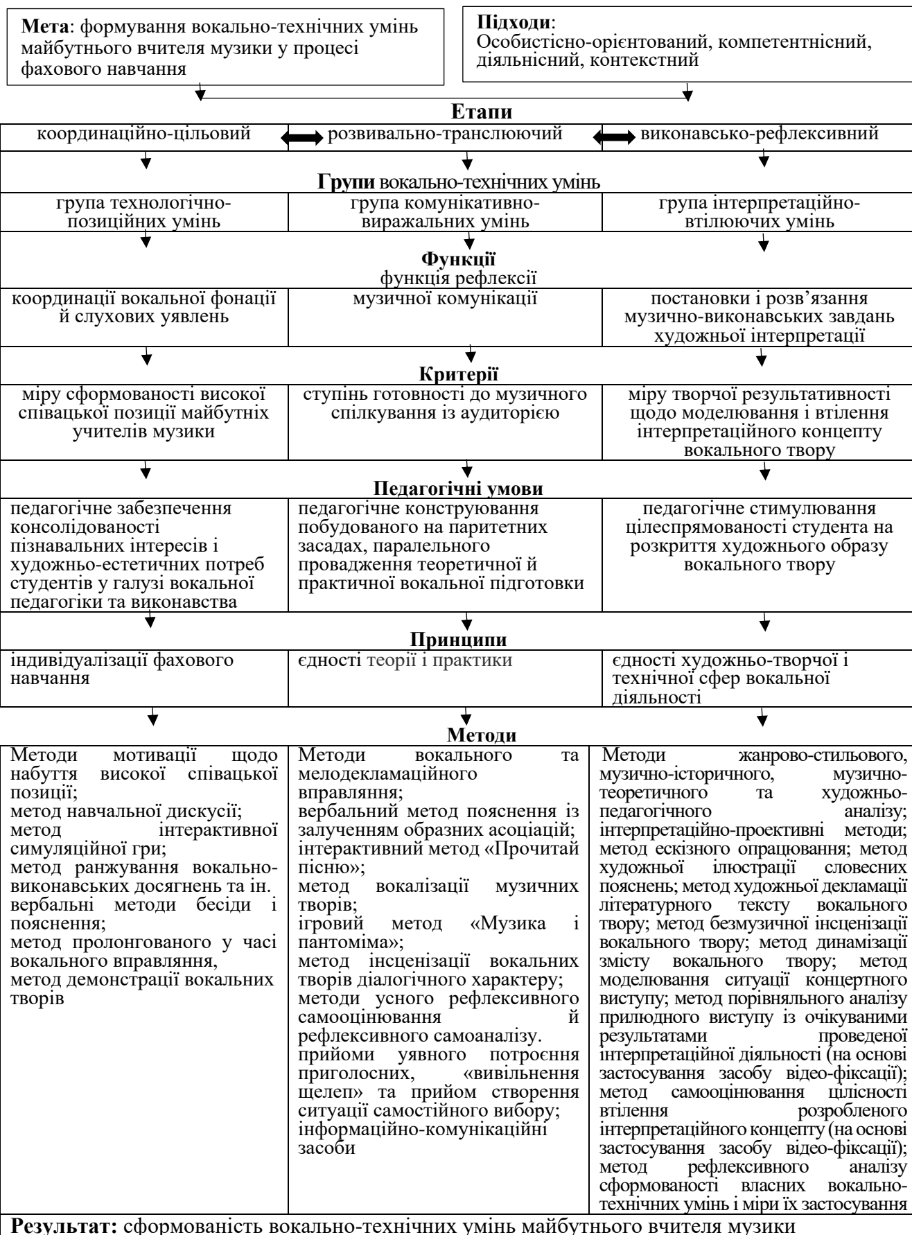
Рис. 2.1. Модель методики формування вокально-технічних умінь майбутнього вчителя музики