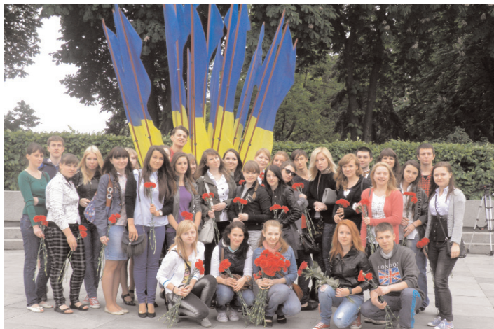
Студенти в Парку Слави