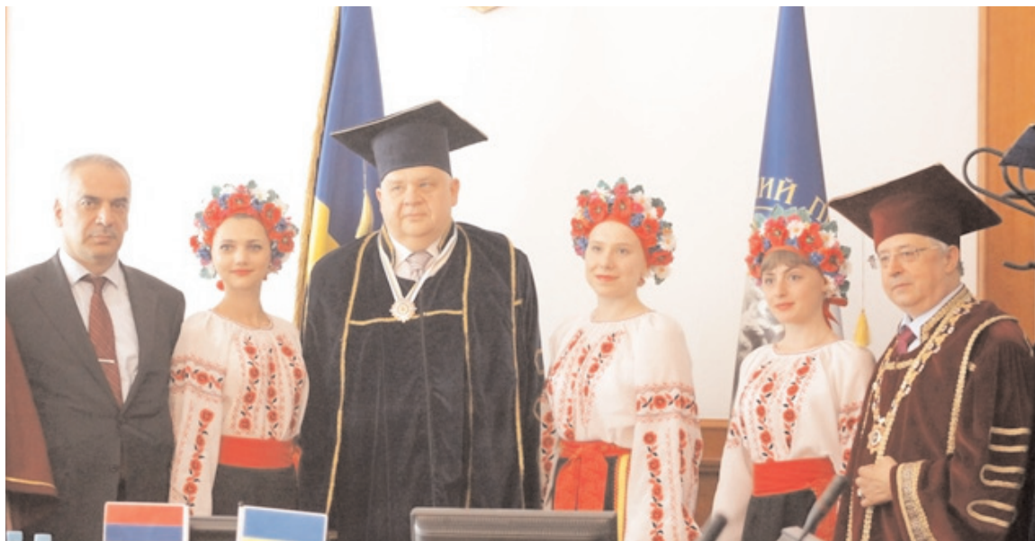
20 травня 2013 р. на урочистій Вченій Раді університету мантію Почесного професора НПУ отримав ректор Вірменського державного педагогічного університету імені Хачатура Абовяна Рубен Мирзаханян

НАЦІОНАЛЬНОГО ПЕДАГОГІЧНОГО УНІВЕРСИТЕТУ ІМЕНІ М. П. ДРАГОМАНОВА