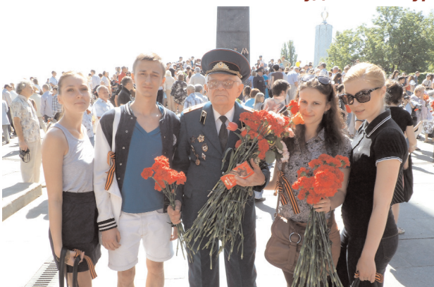
Вручення квітів ветеранам