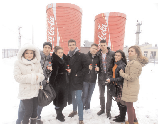
Біля заводу улюбленого напою

Переглянувши сторінки розвитку Коли, студенти ознайомилися з яскравими короткометражними фільмами, які використовували в різних країнах світу в як рекламу.