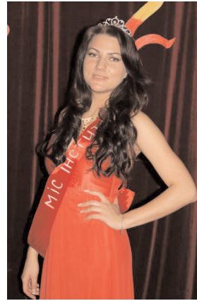
Переможниця конкурсу Міс ІІФГОіЕ

Вихід у вечірніх сукнях неймовірної краси: під пісню Coldplay – Paradise дівчата у супроводі своїх кавалерів дефілювали та зачарували око ніжним вальсом.