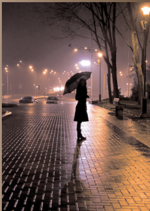
Вікторія Тищук "Мій спокій"