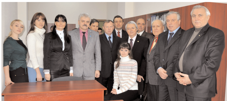
Колектив новоствореної кафедри та ректорат