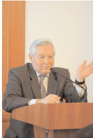
Академік Іван Бех виступив на пленарному засіданні

Метою гуманітаріїв було звернути увагу на сучасний стан суспільства та освіти в контексті діалогу культур. Засобом розкриття цих питань на основі конкретних прикладів стала регіоніка. Як зазначила під час пленарного виступу професор Галина Меднікова , сьогодні регіоніка є контекстом існування універсального. Кожен регіон виражає свої індивідуальні особливості, на основі вивчення яких ми можемо робити висновки про основні загальні тенденції розвитку культури у співвідношенні з діалогом культур.